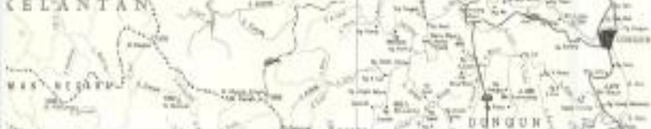
PETA NO. 1

PETA SEMPADAN BERSAMA NEGERI PAHANG DAN TERENGGANU MERATAKAN YANG TELAH DITANDA DAN DIUKUR BAGI KAWASAN-KAWASAN I HINGGA V DUNGUH